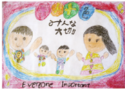
「かぞく」 茨城町立葵小学校 2年 ネオバナ スプラト